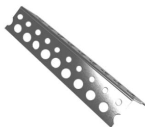
Cantoneira Zincada Perfurada